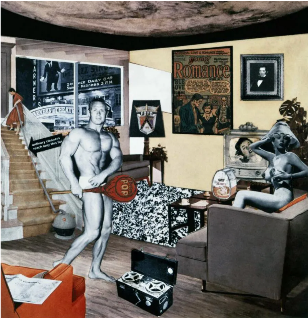
Richard Hamilton, Just What is It That Makes Today's Homes So Different, so Appealing? , 1956, collage, 26 cm × 24.8 cm (Kunsthalle Tübingen, Tübingen)

Alhoewel het interdisciplinaire vanaf het kubisme al aanwezig was (Picasso, assemblages), wordt het gemeengoed vanaf de Pop Art.