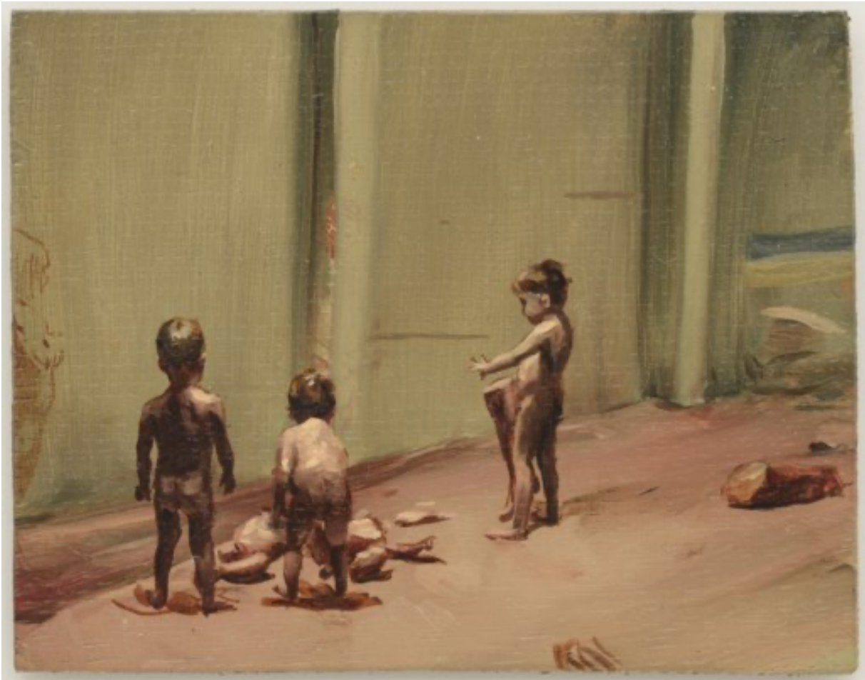
'Fire from the sun' , 2017.

De modellen waren kinderen van vrienden. 'Ik hoop dat die kindjes geen trauma's hebben opgelopen', zegt hij lachend. 'Maar ze hebben zich goed geamuseerd, hoor. Ze hebben zichzelf ook ingesmeerd met filmbloed. Het was heel moeilijk om ze te - regisseren omdat ze continu heen en weer liepen.'