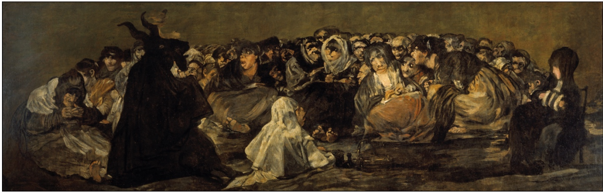
Heksen op Sabbat, Museo del Prado, 1821 - 1823

De schilderkunst van Francisco de Goya (1746–1828) is opmerkelijk vanwege de diversiteit en evolutie die hij doormaakte tijdens zijn lange carrière. Goya's werk is door de tijd heen van de rococo naar het romantisme gegaan, met invloeden uit de neoclassicistische en barokke periodes. Zijn stijlkenmerken zijn veelzijdig en weerspiegelen zijn diepe betrokkenheid bij sociale en politieke kwesties. Enkele belangrijke stijlelementen van Goya's schilderkunst zijn: