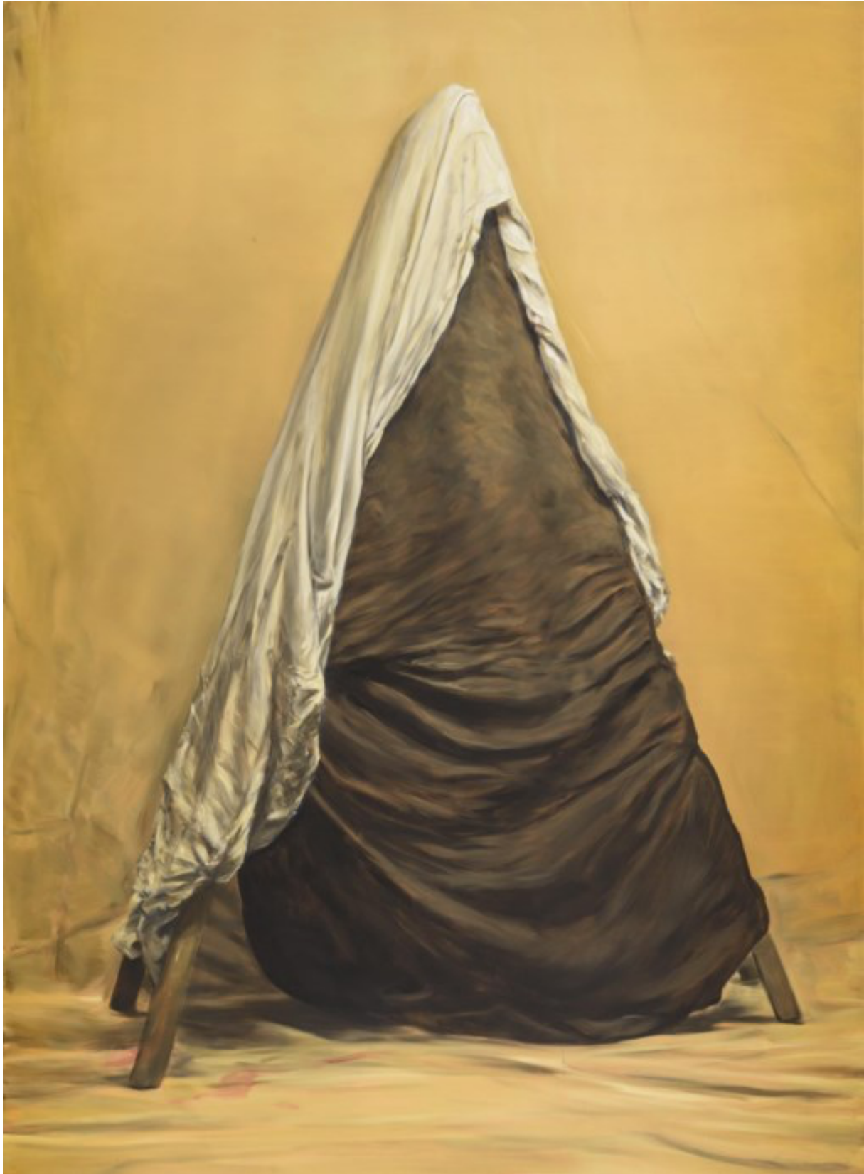
'Mercy' , 2017.

En daar is Borremans in geslaagd. De tentoonstelling baadt in de beklemmende, ondefinieerbare sfeer waarvan de kunstenaar zijn handelsmerk heeft gemaakt.